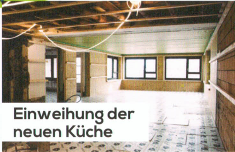
Einweihung der neuen Küche